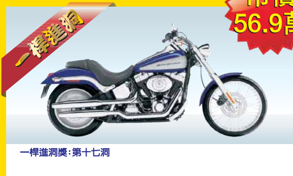
一桿進洞獎:第十七洞