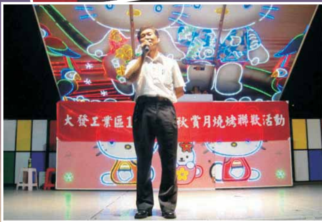
▲ 顏理事長於中秋節晚會上致詞剪影

中秋賞月燒烤聯歡活動不但是齊聚團圓慶中秋、花好月圓人團圓的日子，也充滿著喜樂與滿足的氣氛，亦是一個連嫦娥也欣羨的晚會。