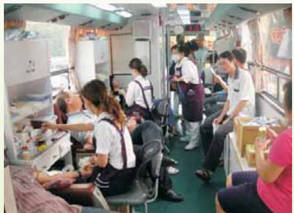
▲大發工業區廠商員工踴躍捐血情形