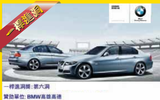
一桿進洞獎:第六洞 贊助單位: BMW高雄高球