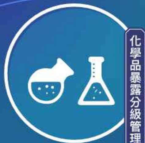
化學品暴露分級管理