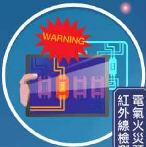
電氣火災預防 紅外線檢測